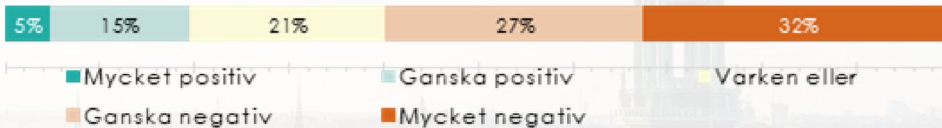
Figur 37: I stadsmiljön finns numera allt fler elsparkcyklar. Vad anser du om dessa?