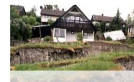
Ras och skred